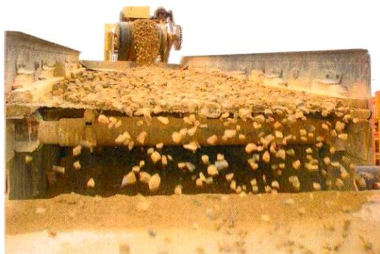
«Модернизация дробильно-сортировочного комплекса» ООО Автодор г.Сыктывкар 30,5 млн руб.

За 2021-2022 г. профинансировано 7 проектов на 185 млн руб.