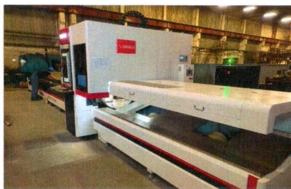
«Модернизация и техническое первооружение заготовительного участка» ЗАО УЭМЗ г.Ухта 14 млн руб.