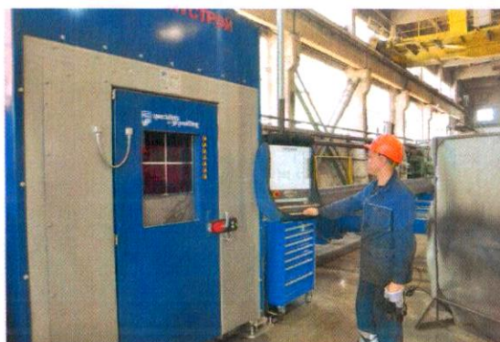
«Модернизация металлообрабатывающего производства» ООО Промбытстрой г.Сыктывкар 50 млн руб.