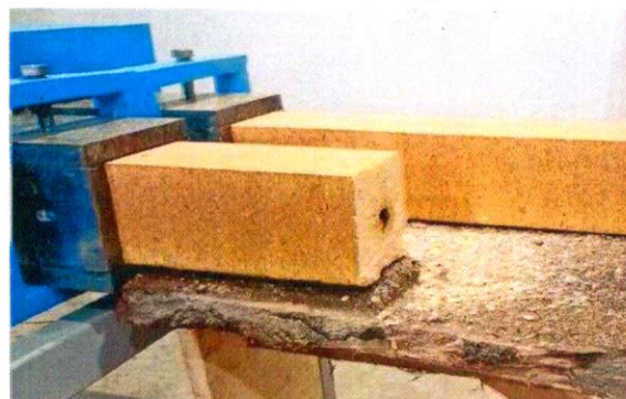
«Производство прессованного бруса на площадке Княжпогостского завода ДВП» ООО Плитный мир г. Емва 13 млн руб.