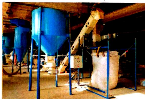
«Производство топливных гранул (пеллет)» г. Сыктывкар. ИП Кармановская И.А. 19,2 млн руб.