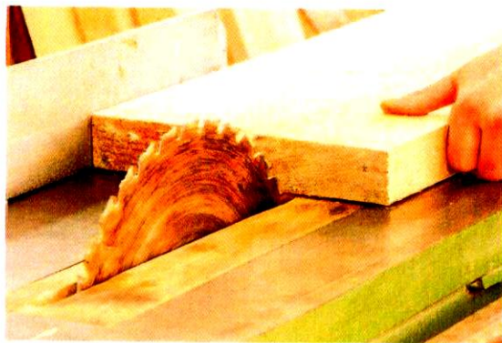
«Создание лесопильного производства» с. Летка, Прилузский р-н ООО Кристалл 19,6 млн руб.

В 2021-2022 г. профинансировано 8 проектов на 122,5 млн руб.