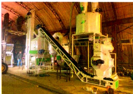
«Производство топливных гранул (пеллет) и расширение действующего производства» ООО МК Лес г.Сыктывкар 15,5 млн руб.

В 2021-2022 г. профинансировано 4 проекта на 48,7 млн руб.