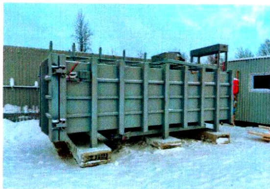
«Организация деятельности по сушке и термообработке пиломатериалов» ИП Скальский О.А. г.Сыктывкар 5 млн руб.