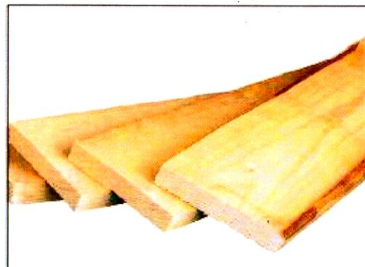
«Расширение действующего производства, направленного на комплексную переработку древесных отходов» г. Сыктывкар. ИП Кармановская И.А. 6,2 млн руб.