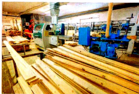
«Создание современного деревоперерабатывающего производства на базе ООО «АТАК» г.Сыктывкар 19,8 млн руб.