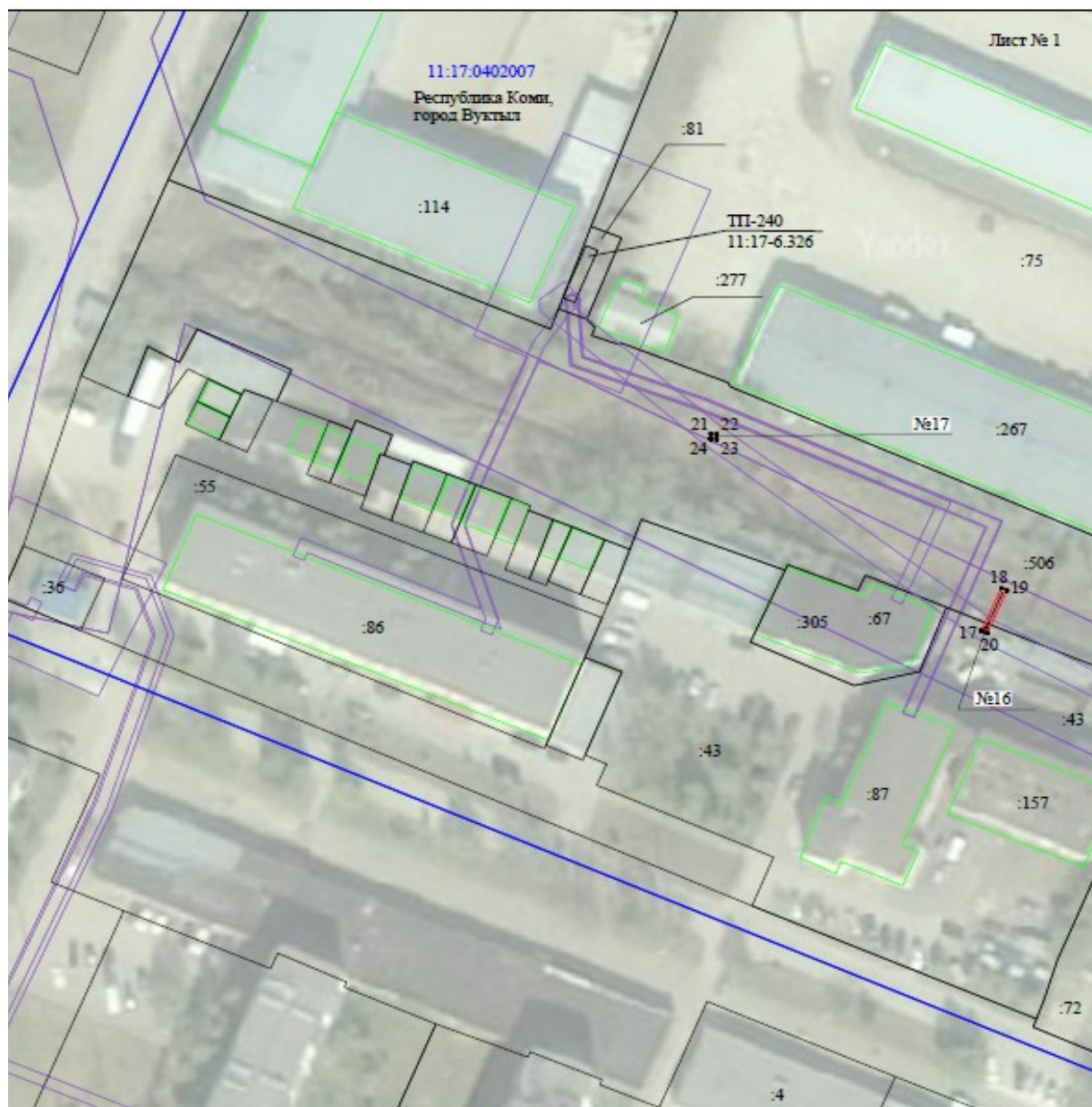
Схема расположения границ публичного сервитута объекта: ВЛ-0,4 кВ ф. 5 ТП № 240 г. Вуктыл.