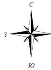
Схема расположения границ публичного сервитута объекта: КЛ-0,4 кВ ф. 4 яч. 5 ТП № 4 - ВРУ-0,4 кВ ул. Коммунистическая, д. 5, ул. Комсомольская, д. 21 г. Вуктыл.