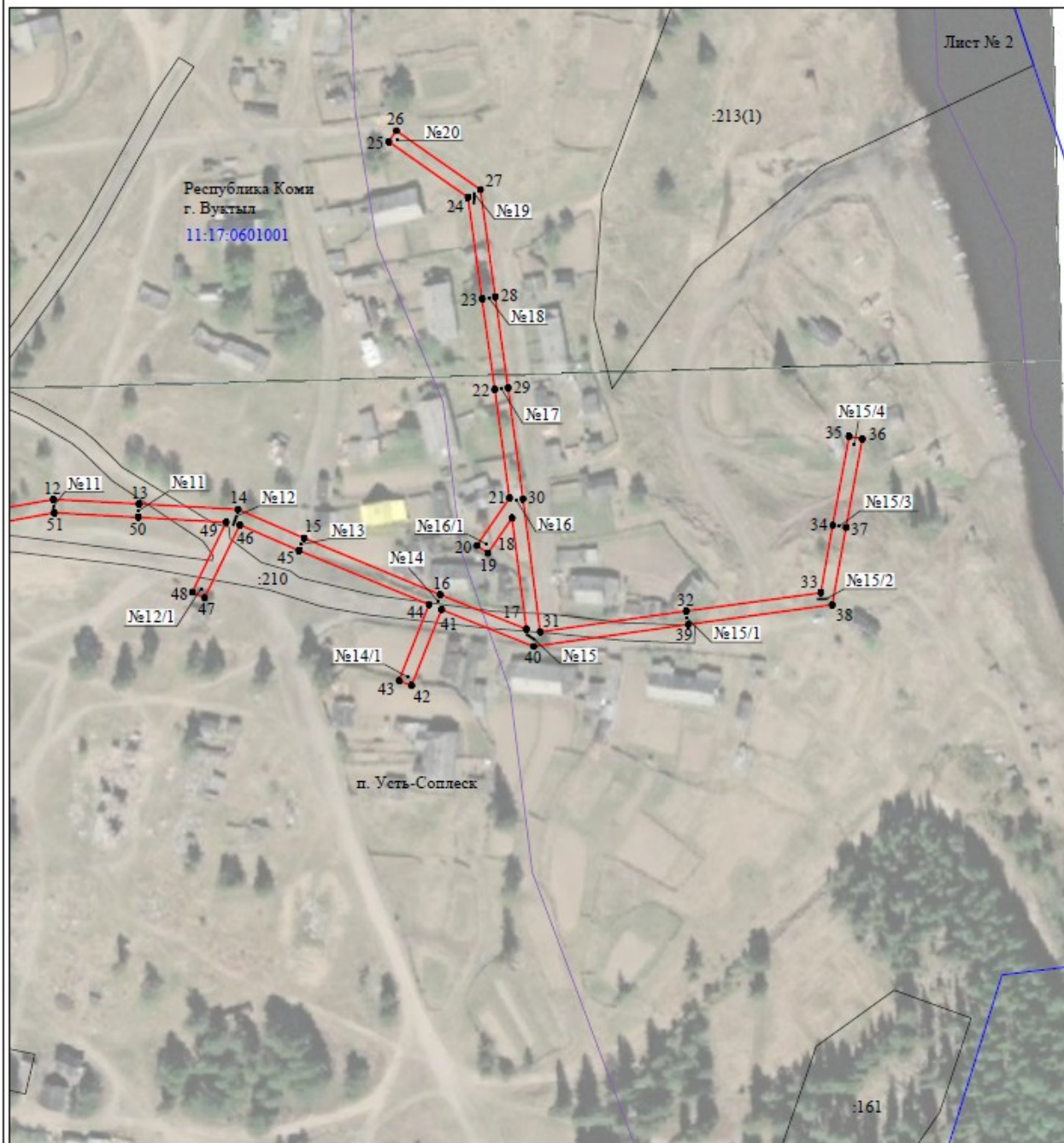
Схема расположения границ публичного сервитута объекта